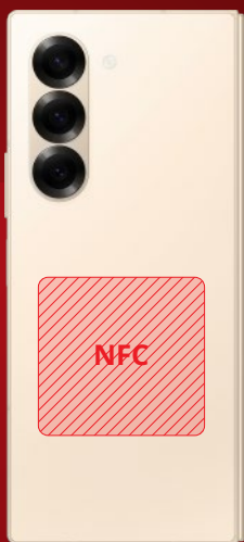
Samsung Galaxy Fold