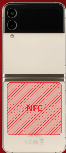
Samsung Galaxy Flip