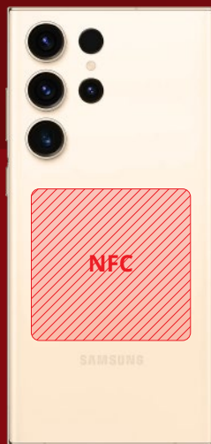
Samsung Galaxy S23 Ultra